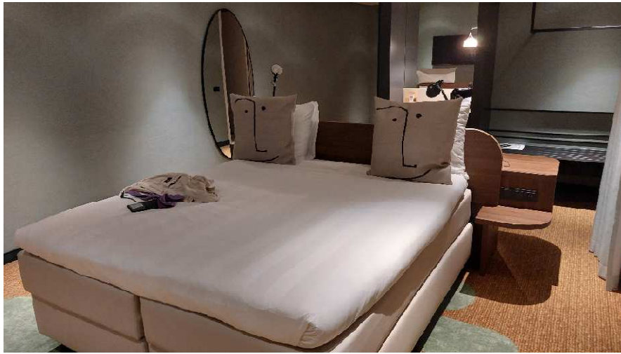
Amsterdam, nicht geplant