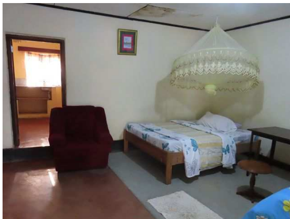
Manda Lodge, Chinteche