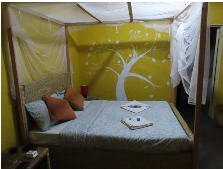
Lodge Macombo, Mzuzu