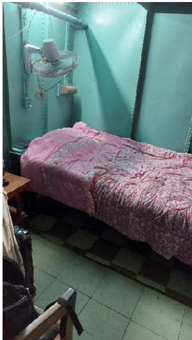
Kabine auf der Ilalla